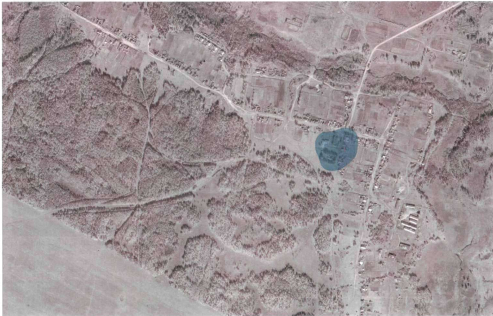
Рис. 2.2 – Зона действия теплоснабжения котельной №29