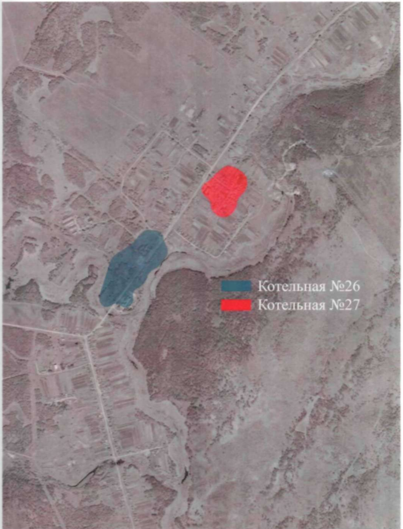
Рис. 2.1 – Зоны действия теплоснабжения котельной №26 и котельной №27