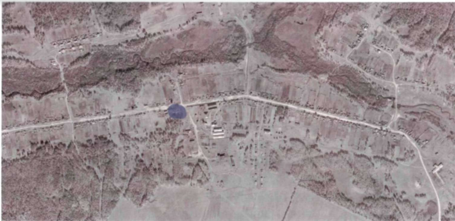
Рис. 2.3 – Зона действия теплоснабжения котельной №30