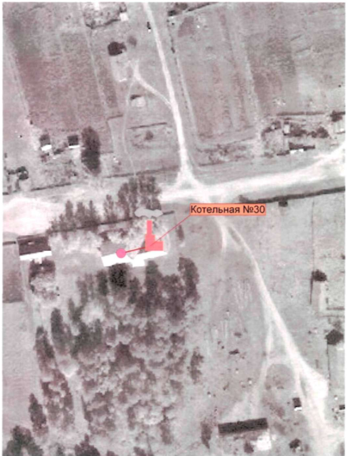
Рис. 2.7 – Схема теплоснабжения муниципального образования "Климоуцевский сельсовет" от котельной №30