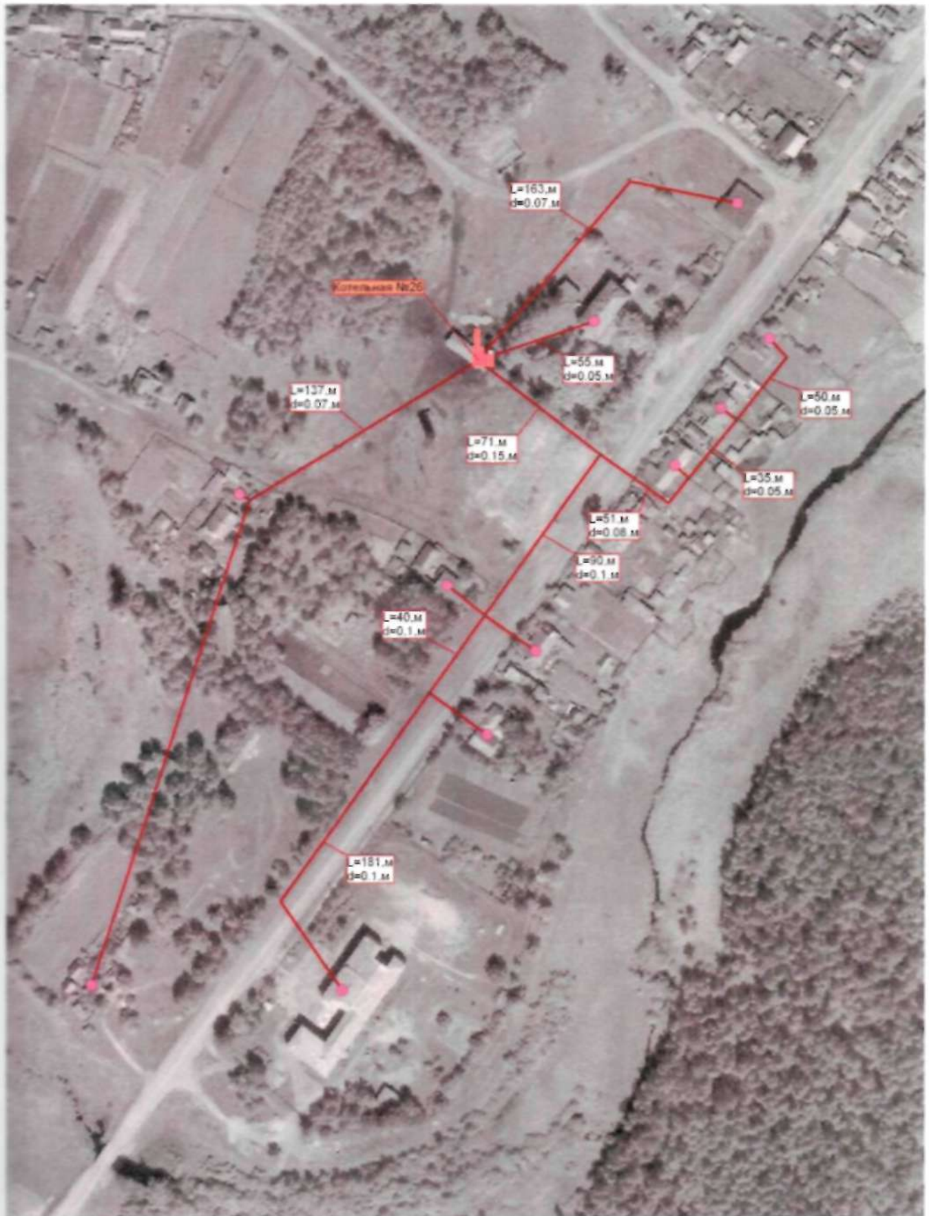
Рис. 2.4 – Схема теплоснабжения муниципального образования "Климоуцевский сельсовет" от котельной №26